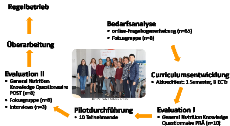
Abb. 1: Entwicklungsprozess des Lehrgangs Jugend-ErnährungsmentorIn

Um den Lehrgang zielgruppenspezifisch zu gestalten, wurde ein mehrstufiger Entwicklungsprozess mittels Mixed-Methods-Ansatz durchgeführt (siehe Abb. 1). Zur Evaluierung der Effektivität wurde ein prä-post-Vergleich des Ernährungswissens der Teilnehmenden mittels General Nutrition Knowledge Questionnaire (=GNKQ) durchgeführt (De Souza Silveira et al., 2015).