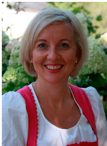
Die Angebote wurden sehr gut angenommen.

Gefördert aus den Mitteln des Fonds Gesundes Österreich