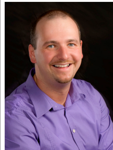
„Gemeinsam bewusst gesund“ war ein tolles Projekt.

Weitere Informationen zum ASKÖ-Projekt „Gemeinsam bewusst gesund“ erhalten sie bei Eduard Renner, ASKÖ Salzburg, Tel: 0676/6071337, renner@clubaktivgesund.at . Das ASKÖ-Gesundheitsförderungsprojekt wird 2017 aus Mitteln des Fonds Gesundes Österreich, des Bundes-Sportförderungsfonds und der Salzburger Gebietskrankenkasse gefördert.