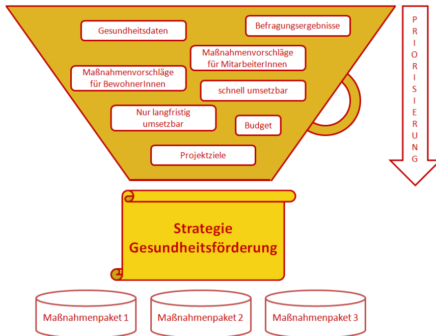
Abb. 3: Trichterfunktion der Phase Strategie- und Maßnahmenplanung

Wesentlich in dieser Phase ist immer wieder den Bezug zu den vorab definierten Projektzielen herzustellen und die unterschiedlichen Zielgruppen bei der Ausarbeitung der Gesundheitsförderungsstrategie einzubinden.