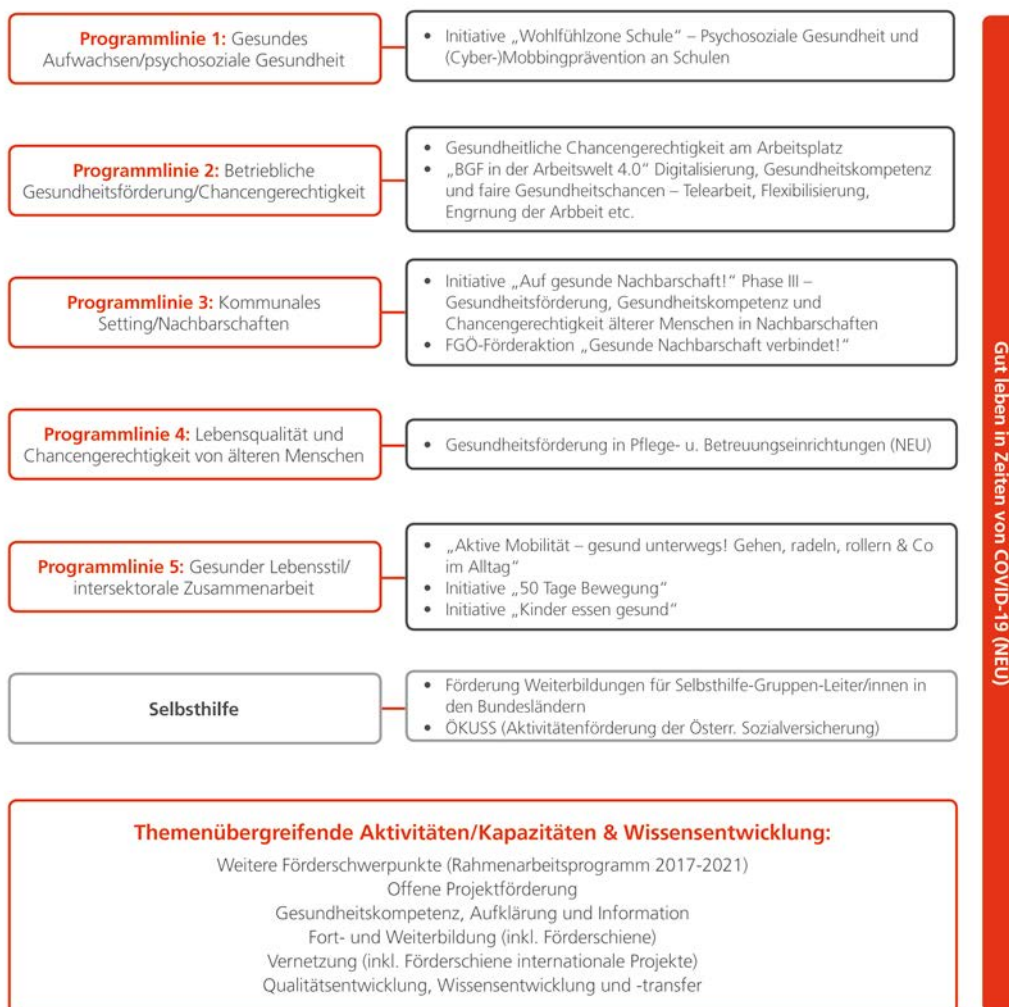
Abb. 1: Programmlinien und (Förder-)Schwerpunkte 2021

Die nachfolgende Grafik gibt einen Überblick über die geplanten Schwerpunkte 2021: