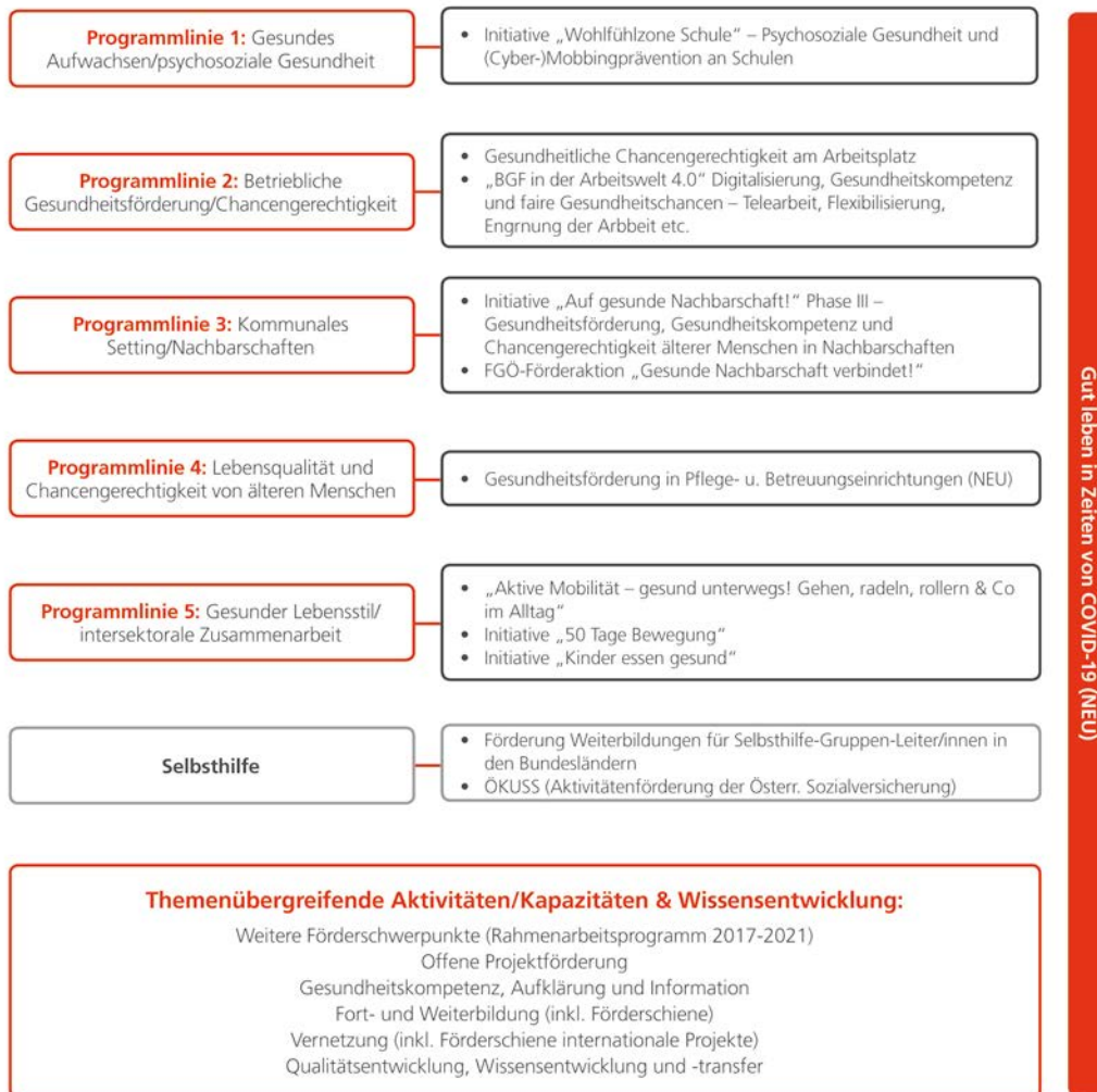
Abb. 1: Programmlinien und (Förder-)Schwerpunkte 2021

Die nachfolgende Grafik gibt einen Überblick über die geplanten Schwerpunkte 2021: