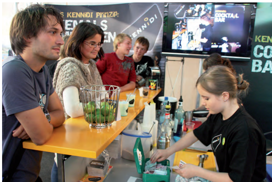
Das Projekt „KENNiDI“ macht Jugendlichen alkoholfreie Cocktails schmackhaft.