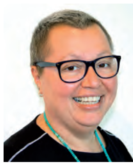
Sabine Oberhauser: „Gesundheitsförderung ist in vielen Ländern zu einer wichtigen Säule des Gesundheitssystems geworden.“