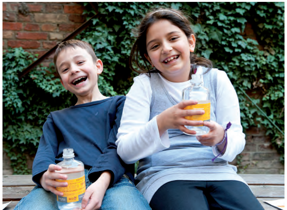
Die Erkenntnisse aus dem Projekt „Wiener Jause“ werden nun auch bei dem Folgeprojekt „Wassertrinken an Wiener Volksschulen“ genutzt.