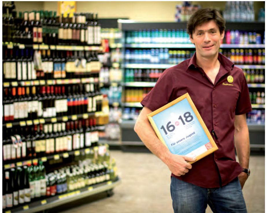
Zum Projekt „Jugend und Alkohol“ gehören auch Maßnahmen, die dafür sorgen, dass im Handel keine Alkoholika oder gebrannten Alkoholika an Jugendliche unter 16 und 18 Jahren abgegeben werden.