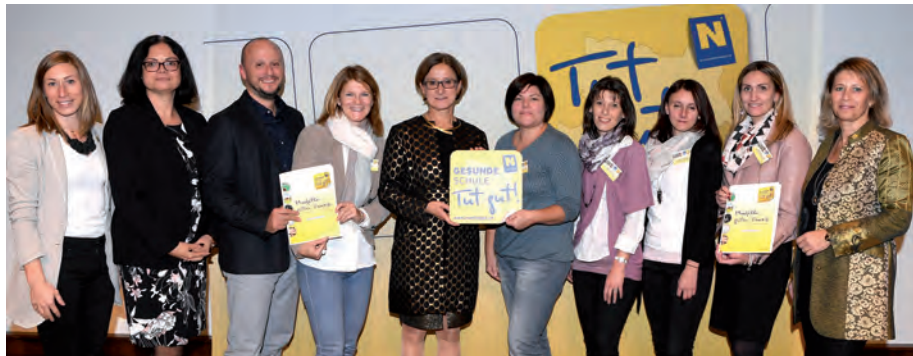
Beim niederösterreichischen „Gesunde Schule“-Tag mit Landeshauptmannstellvertreterin Johanna Mikl-Leitner (in der Mitte) wurden unter anderem auch Modelle „Guter Praxis“ aus sechs Schulen vorgestellt.

Das Programm „Gesunde Schule“ der niederösterreichischen Initiative „Tut gut!“ für Schulen der Sekundarstufe I, wie Neue Mittelschulen, Hauptschulen und AHS-Unterstufen, gibt es seit dem Schuljahr 2007/08. Mittlerweile nehmen 117 Ausbildungsstätten daran teil. Die Schulen werden von fünf „Gesunde Schule“-Berater/innen der Initiative „Tut gut!“ begleitet und betreut. Ziel des Programmes ist es, den Lern- und Arbeitsort Schule gesundheitsfördernd zu gestalten, um die Gesundheit aller Beteiligten zu fördern und das Lehren und Lernen zu unterstützen. Eine Steuerungsgruppe aus „Gesunde Schule“-Beauftragten, Lehrer/innen, Schüler/innen, Schulleiter/innen und Eltern legt schulinterne Gesundheitsziele fest und setzt