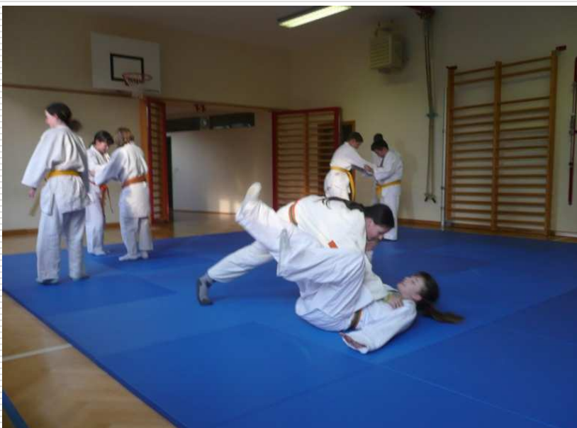
Judo – in voller Aktion

Gemeinsam gesund bewegen in der Gemeinde Floing