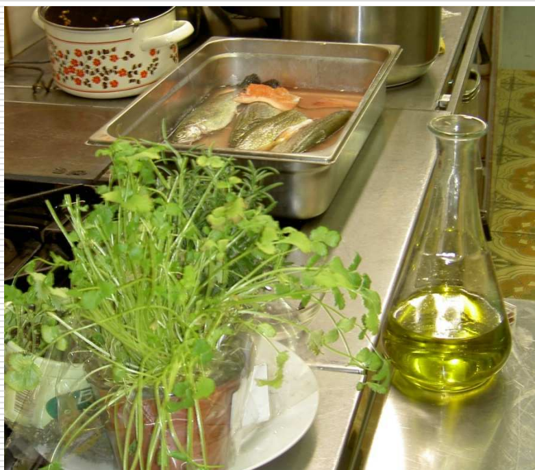
Kochkurs „Fisch mal anders“

Gemeinsam gesund bewegen in der Gemeinde Floing