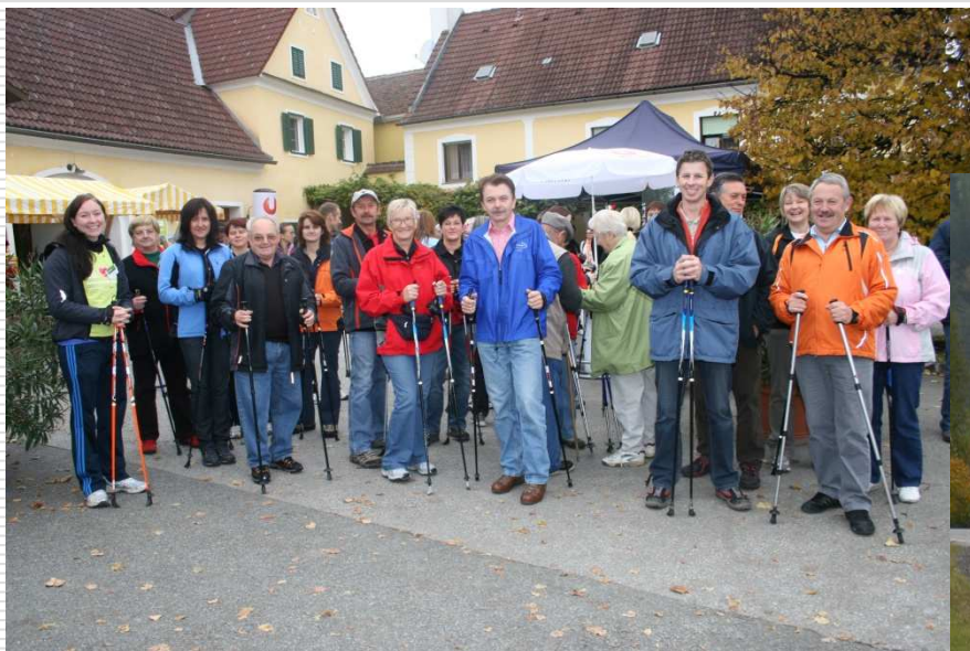
Walken ist sehr beliebt