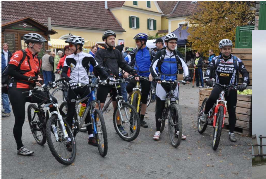
Start der MTB-Tour auf den Kulm

Gemeinsam gesund bewegen in der Gemeinde Floing