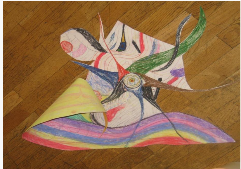
Gesunder Bezirk Gries