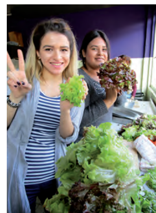
Gemeinsames Kochen und der Anbau von Kräutern und Gemüse gehörten ebenfalls zu dem Projekt für Jugendliche in Dornbirn, bei dem auch drei selbst gestaltete Kochbücher entstanden sind.