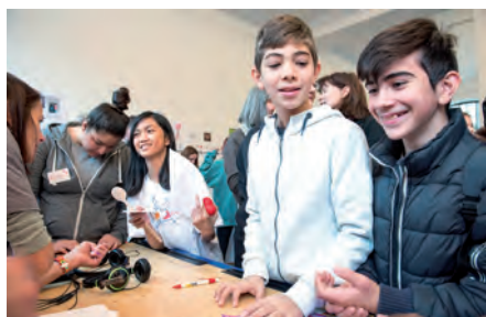
Die Jugendgesundheitskonferenzen fanden bislang in 19 der 23 Wiener Bezirke statt.