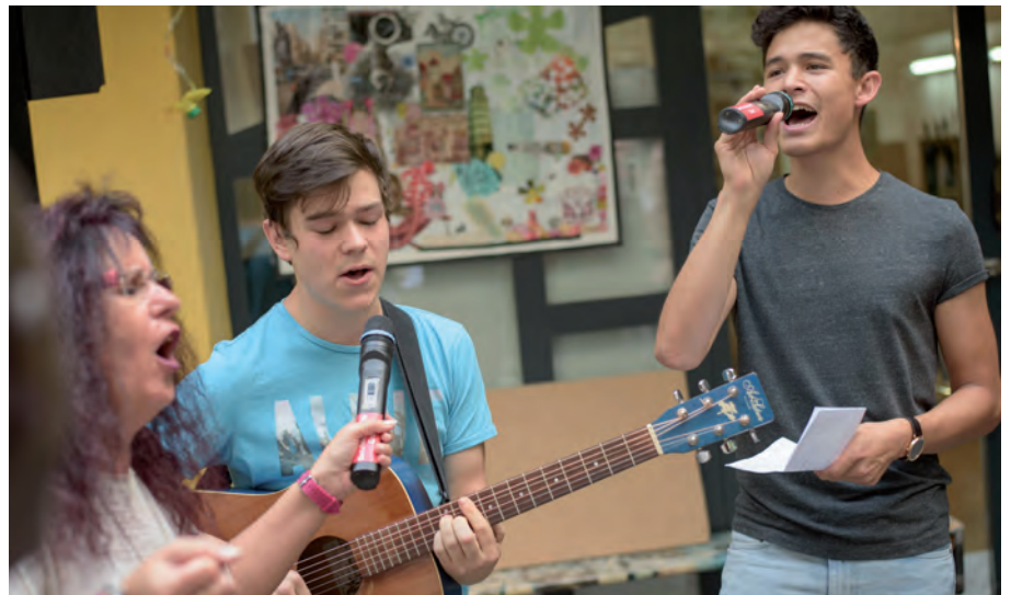
Beim Zehn-Jahres-Fest der Grazer Einrichtung für 15- bis 25-Jährige ist auch der „heidenspass“-Chor aufgetreten.