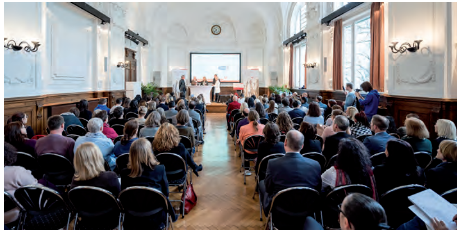
Im Dezember fand in Wien die Abschlussveranstaltung für das Transferprojekt „health4you“ des Fonds Gesundes Österreich statt.

Ein erfolgreiches Projekt wurde auf acht Einrichtungen für Überbetriebliche Lehrausbildung in vier Bundesländern transferiert. Text: Dietmar Schobel