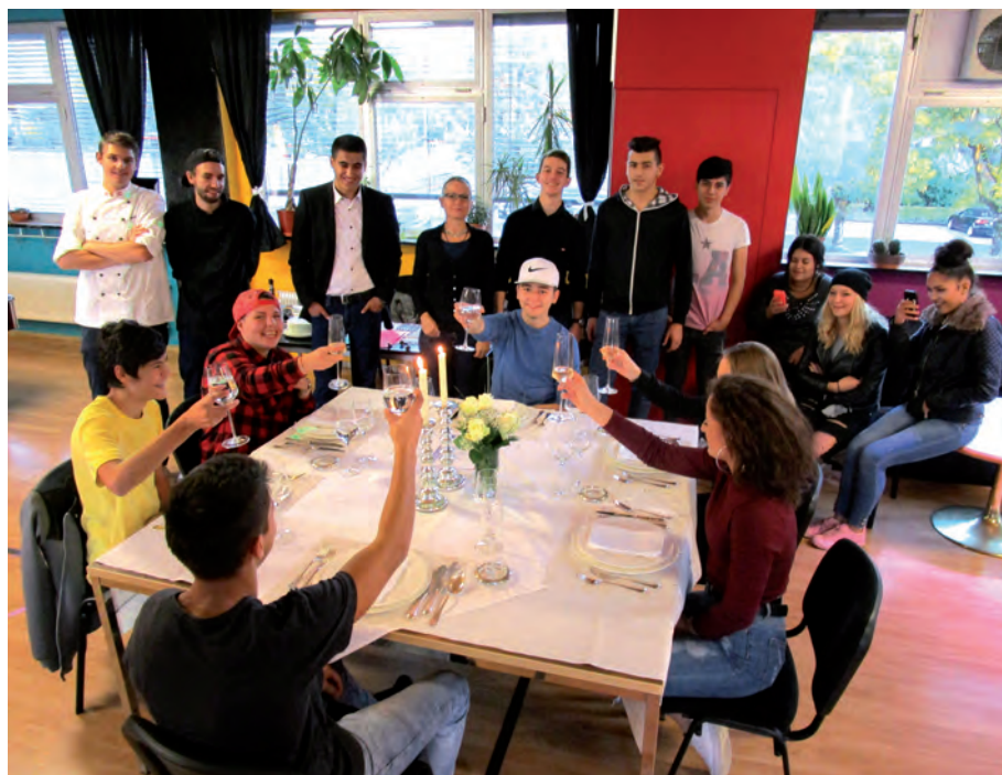
Das „Tischkultur Survival Training“ fand bei den Teenagern großen Anklang.