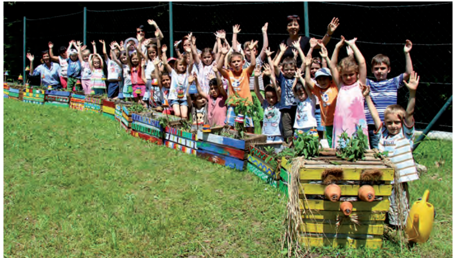
Bei den Programmen für gesündere Kindergärten werden verschiedenste Aktivitäten durchgeführt, zum Beispiel auch einen „Kistenwurm“ im Garten aufzustellen und gemeinsam mit Kräutern zu bepflanzen, wie hier in einem Kindergarten in Hartberg in der Steiermark.