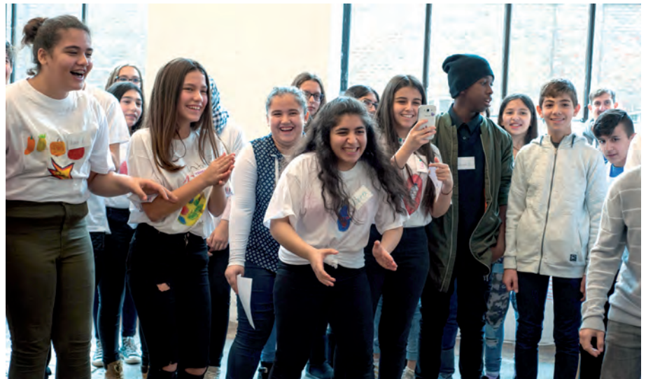
Auch bei den Jugendgesundheitskonferenzen in Wien beschäftigen sich Teenager damit, was „Gesundheit“ für sie bedeutet.