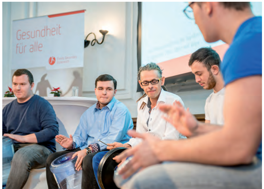
Die Trommlergruppe „Die Wasserspender“ von „Weidinger & Partner“ hat auch bei der Abschlussveranstaltung von „health4you“ für flotte Rhythmen gesorgt.