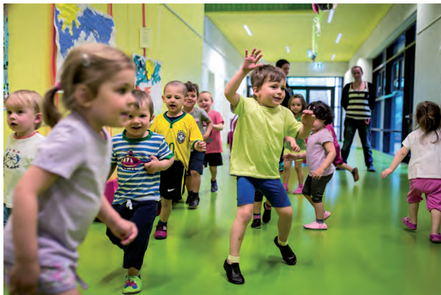
In Wien wurden zwischen 2010 und 2016 verschiedene Projekte für Gesundheitsförderung im Kindergarten umgesetzt. Heuer wird der Aufbau des trägerübergreifenden Netzwerks „Gesund im Wiener Kindergarten“ fortgesetzt.