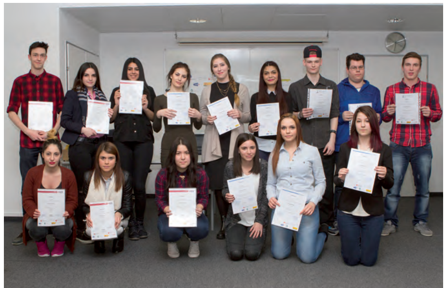
Die „Gesundheits-Buddys“ wurden dafür ausgebildet, Gesundheitswissen an ihre Alterskolleg/innen weiterzugeben.“

Davon ausgehend wurden gemeinsam Vorschläge für gesundheitsförderliche Maßnahmen entwickelt und viele davon wurden auch umgesetzt. So wurde zum Beispiel dafür gesorgt, dass in den Ausbildungsräumen für die Mädchen nun stets