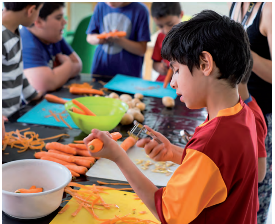
Gemeinsam gesund zu kochen , wie hier im Jugendtreff „alte Trafik“ in Wien-Leopoldstadt, kann die Gesundheitskompetenz von Kindern und Jugendlichen erhöhen.