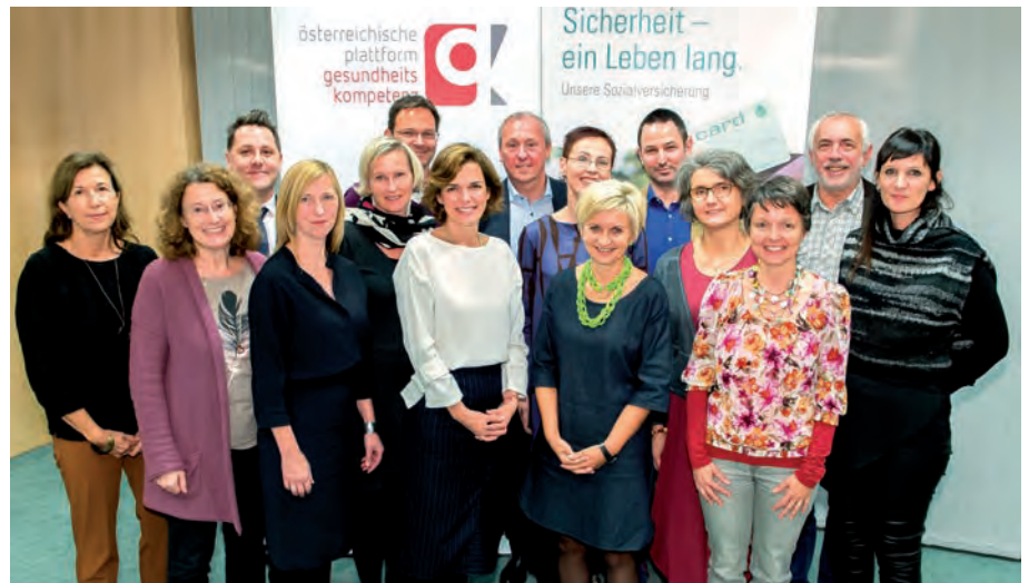
Gesundheitsministerin Pamela Rendi-Wagner mit dem Kern-Team der Österreichischen Plattform Gesundheitskompetenz.

Basis dafür sind richtige, evidenzbasierte und zugleich einfach verständliche Informationen. Die „Gute schriftliche Gesundheitsinformation“ und die „Gesprächsqualität im Gesundheitssystem“ sind deshalb die beiden aktuellen Arbeitsschwerpunkte der Österreichischen Plattform Gesundheitskompetenz (ÖPGK). Mit der „Guten Gesundheitsinformation Österreich“ liegt seit März auch eine vom Frauengesundheitszentrum Graz erarbeitete Beschreibung der Grundlagen für qualitativ hochwertige Gesundheitsinformationen vor. Das 24 Seiten starke Dokument befasst sich etwa damit, was für eine zielgruppengerechte Ansprache oder evidenzbasierte Inhalte zu berücksichtigen ist. Es soll für Institutionen, die Gesundheitsinformationen in Auftrag geben, als Anleitung dafür dienen, eigene Qualitätsstandards zu definieren.