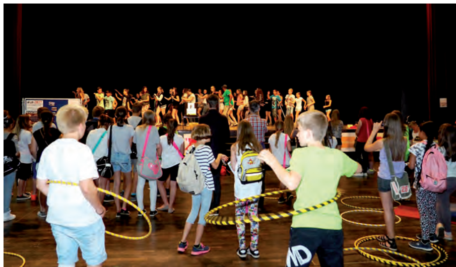
In der Steiermark fanden im Rahmen des Projekts „XUND und DU“ sieben Jugendgesundheitskonferenzen statt.

In den sieben Projektregionen Obersteiermark Ost, Obersteiermark West, Liezen, Südoststeiermark, Oststeiermark, Südweststeiermark und steirischer Zentralraum wurde jeweils auch ein Netzwerk aus Multiplikatorinnen und Multiplikatoren der schulischen und außerschulischen Jugendarbeit sowie aus regionalen Gesundheitsexpertinnen und -experten eingerichtet. Die Mitglieder trafen sich regelmäßig, um zu diskutieren und zu erarbeiten, wie die „Gesundheitskompetenz in der Jugendarbeit“ gefördert werden kann. Insgesamt beteiligten sich an 30 Netzwerktreffen etwa 250 Multiplikatorinnen und Multiplikatoren aus 120 unterschiedlichen Organisationen. Die Ideen für die einzelnen Projekte